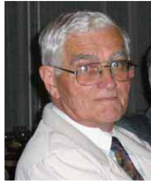
Selmeczy Tibor (1929–2011)