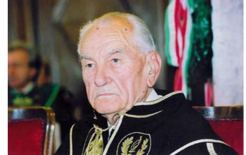
Woynarovich Elek (1915–2011)