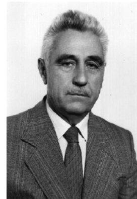
Entz Béla (1919–2011)