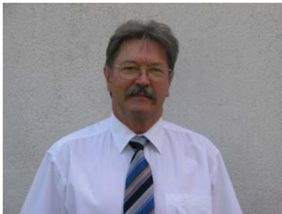
Tátrai István (1947–2011)